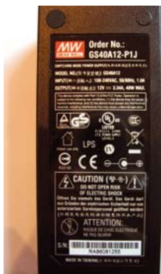
Рис. 1. Пример обозначения Energy Star на корпусе источника питания Mean Well серии GS40

таблице 1. Коммерческое название этой программы — Energy Star IV.